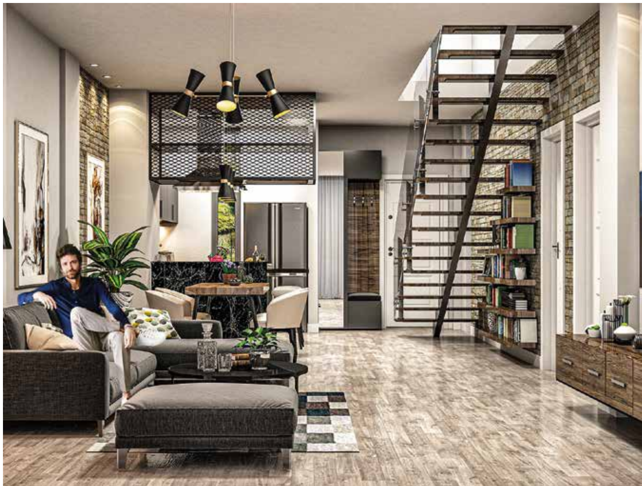
Yunik Villa Interior Виллы Юник Интерьер