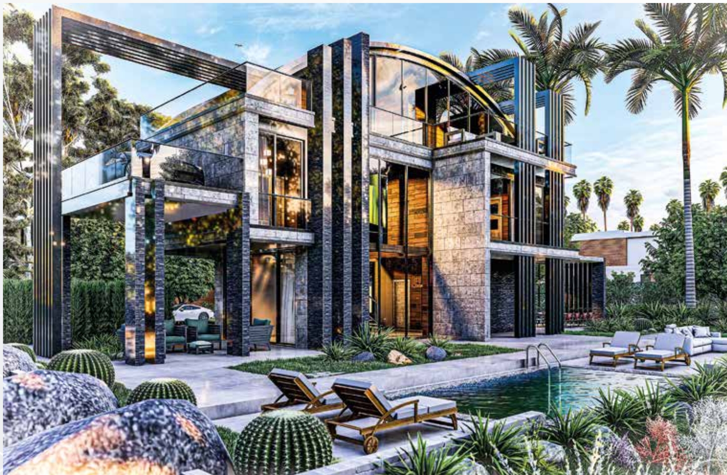
Yunik Villa Exterior Юник Виллас Экстерьер