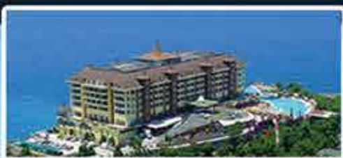
UTOPIA WORLD HOTEL